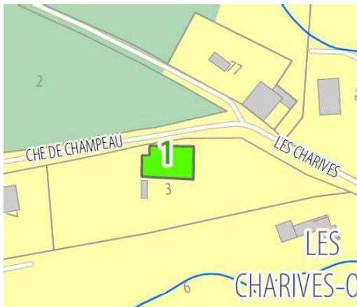
PLUi approuvé PLUi modifié (extrait planche 19)