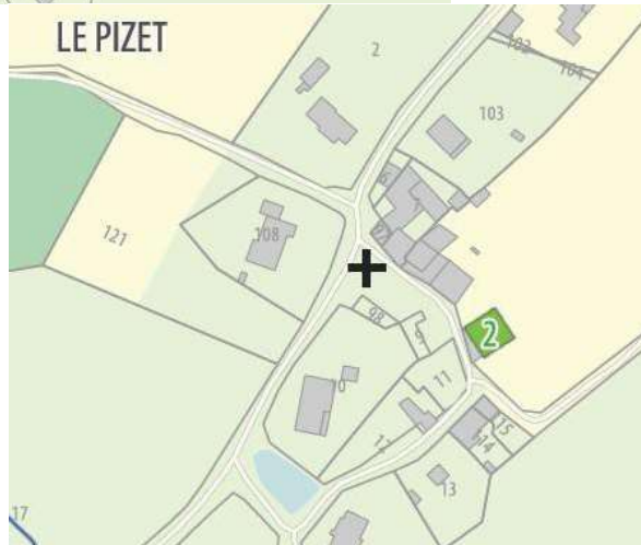
PLUi approuvé PLUi modifié (extrait planche 19)