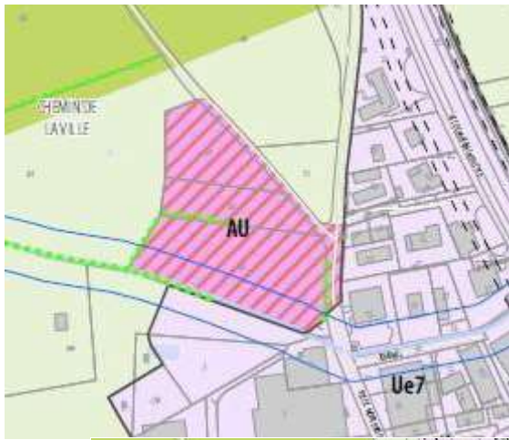
PLUi approuvé (extrait planche 19 et zoom Champdiéu)